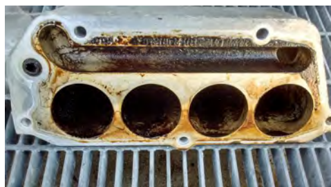
A BIOSOLV HD-vel TISZTÍTOTT ALKATRÉSZ