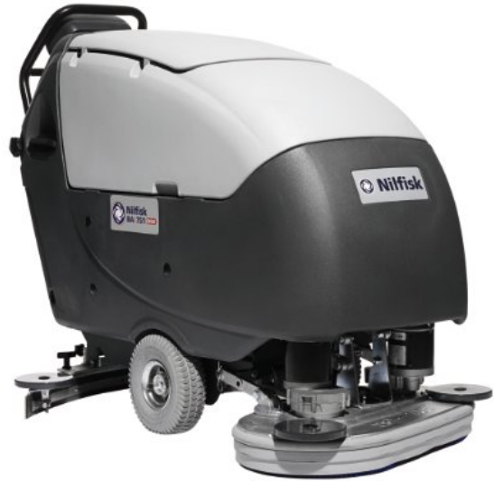
A kép illusztrációként szolgál.

Sokoldalúbb, akár 30 %-kal nagyobb termelékenység, „jobb-mint-valaha” megbízhatóság, rendkívül csendes üzemelés, a legújabb ergonómiával.