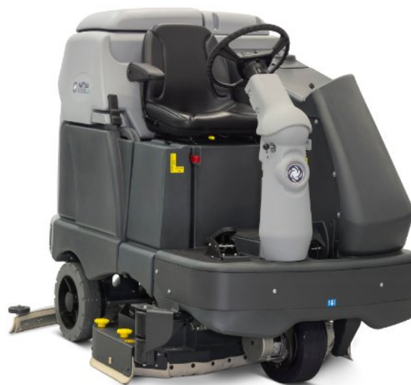
A kép illusztrációként szolgál.

Az SC6500 ideális nagy szupermarketek, raktárak, repterek, parkolók, élelmiszeripari területek és nehézipari területek tisztítására. Választhatunk 1,0 vagy 1,3 m súrolási szélességet mind hengerkefével, mind pedig tányérkefével.